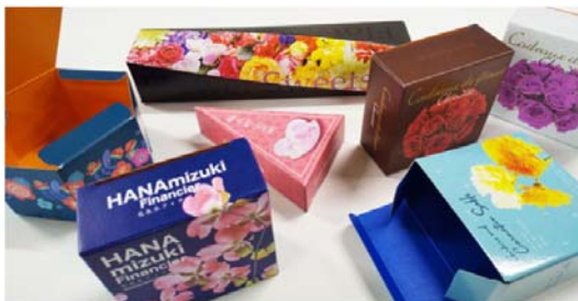
G 段 (Gフルート) は世界最薄の段ボールです